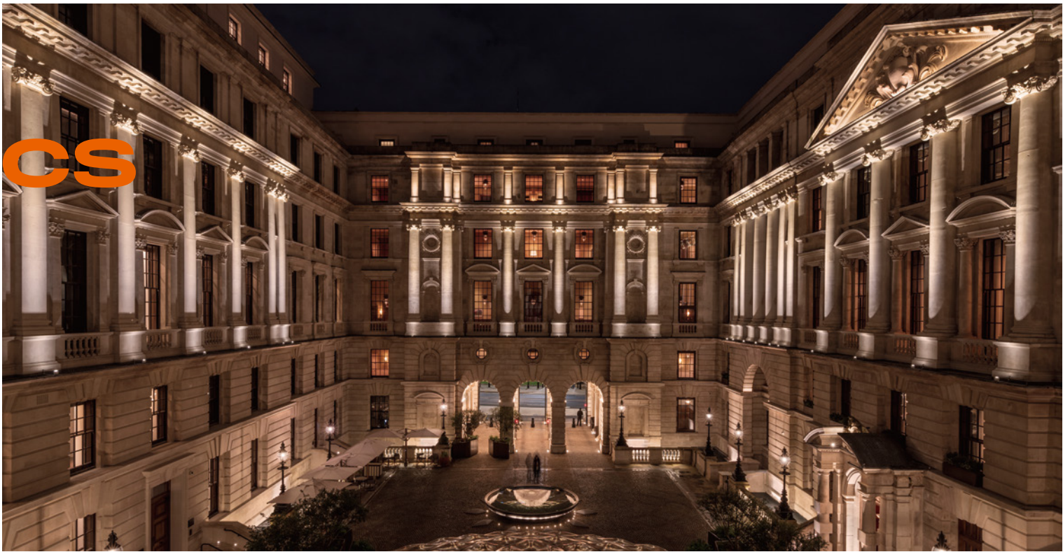
伦敦市中心奢华与典雅的代表。 英国·伦敦OWO莱福士酒店