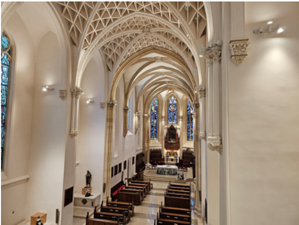
这里是萨格勒布最漂亮的圣景。 克罗地亚·萨格勒布圣方济各教堂