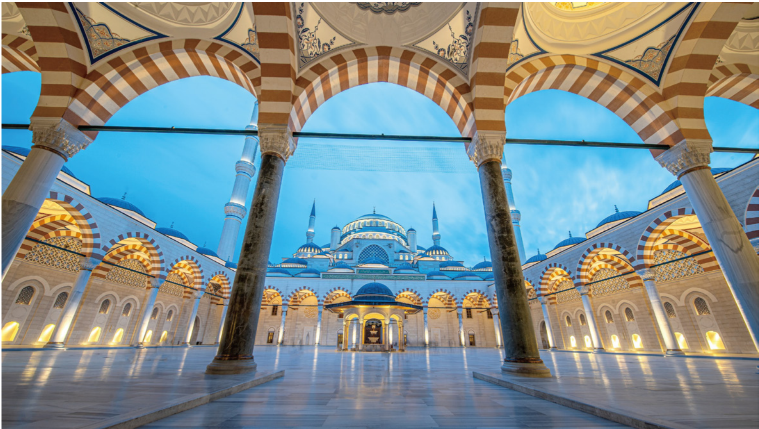
土耳其文化遗产与尖端建筑艺术完美融合的杰作。 土耳其·卡姆利卡大清真寺